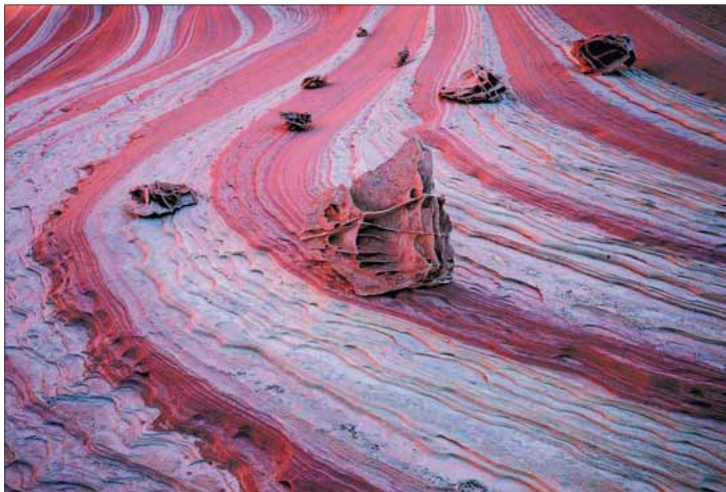
Die ersten Sonnenstrahlen tauchen die wellenartigen Felsformationen in ein violettes Licht. „The endless race“.

Es ist ein großer Spaß diese Gegend zu entdecken und man kann spielend den